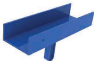
"U" HEAD Beam Type