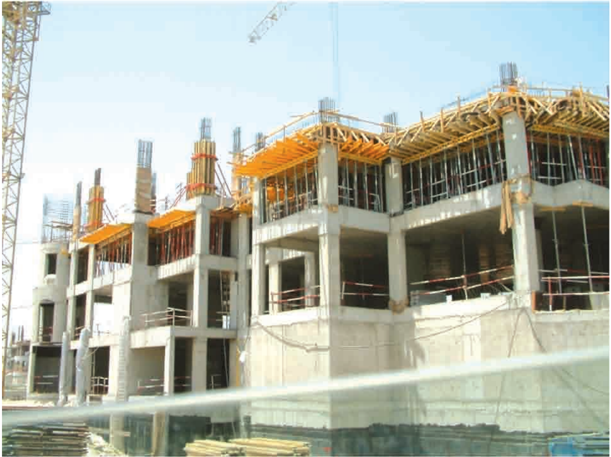
Shoreline Housing Project at Palm Jumeirah, DUBAI U.A.E, BAYTUR